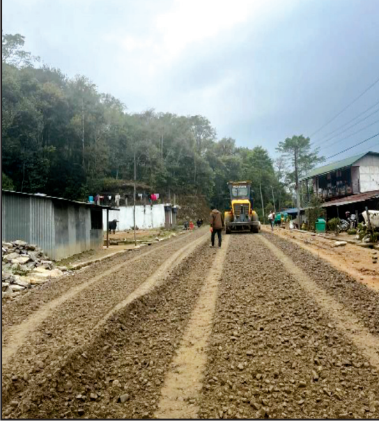
दिङ्ला सतिघाट सडक पिचको लागि ग्रेडरले ग्रेड मिलाउँदै