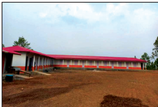
षडानन्द नगरपालिका र U.W.S को साझेदारीमा सिंहदेवी आधारभुत विद्यालय बोयाको ११ कोठे भवन र ५ कोठे सौचालय निर्माण