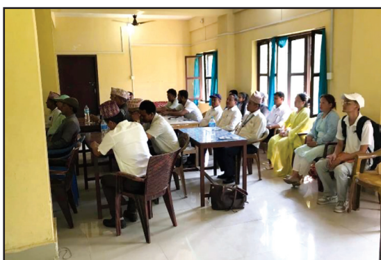
जनप्रतिनिधि र कर्मचारी क्षमता विकास तालिम सन्चालन