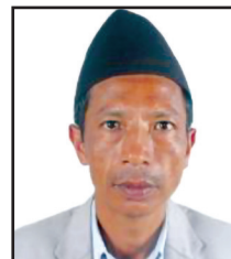
फणिन्द्र मगर वडा सदस्य