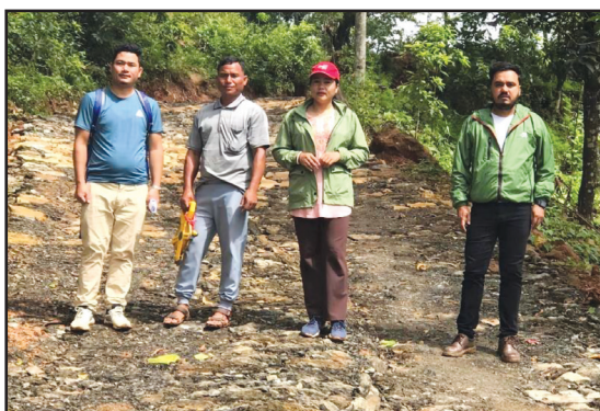
चिउरीबोटे घुमाउने चौतरा बालुवाबेंसी सडक स्तरोन्नती, ष.न.पा.-५