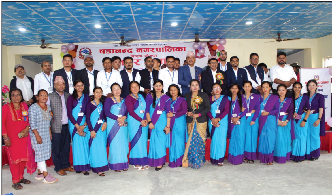
नगरप्रमुख, नगर उप-प्रमुख, प्रमुख प्रशासकीय अधिकृत साथै उपस्थित कर्मचारीहरु सामूहिक तस्वीर लिदै