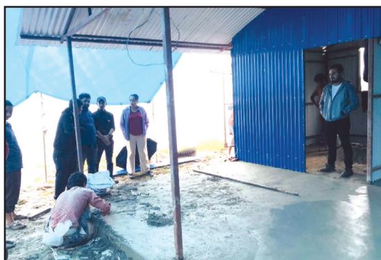
ष.न.पा.-८ मा नमुना कृषि केन्द्र निर्माण गरिदै