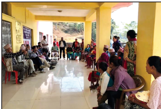
आयुर्वेद औषधालयद्वारा आयोजित पायल्स,फिस्टुला र फिसर रोग सम्बन्धि २ दिने निशुल्क स्वास्थ्य शिविर