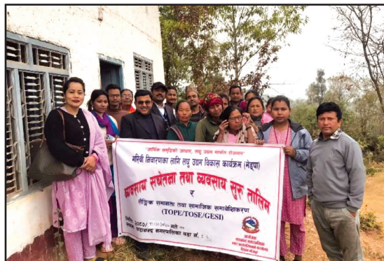
गरिवी निवारणका लागि लघु उद्यम विकास कार्यक्रम (मेडुपा) अन्तर्गत ८ दिने व्यावसाय सचेतना तालिम