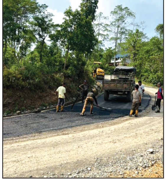
दिङ्ला सतिघाट सडक पिच (पक्की) निर्माण गरिदै