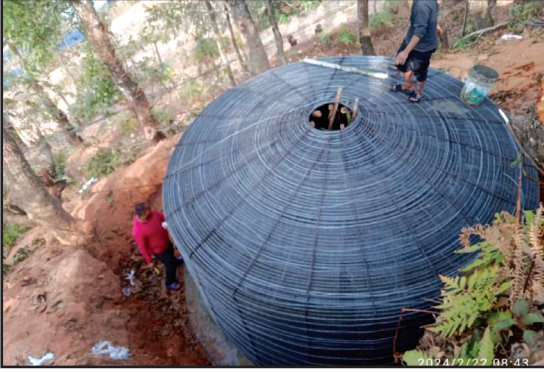
लमुखोला खानेपानी आयोजना अन्तर्गत कैलाश डाँडामा निर्माण भएको रिजर्भ ट्याँक्री