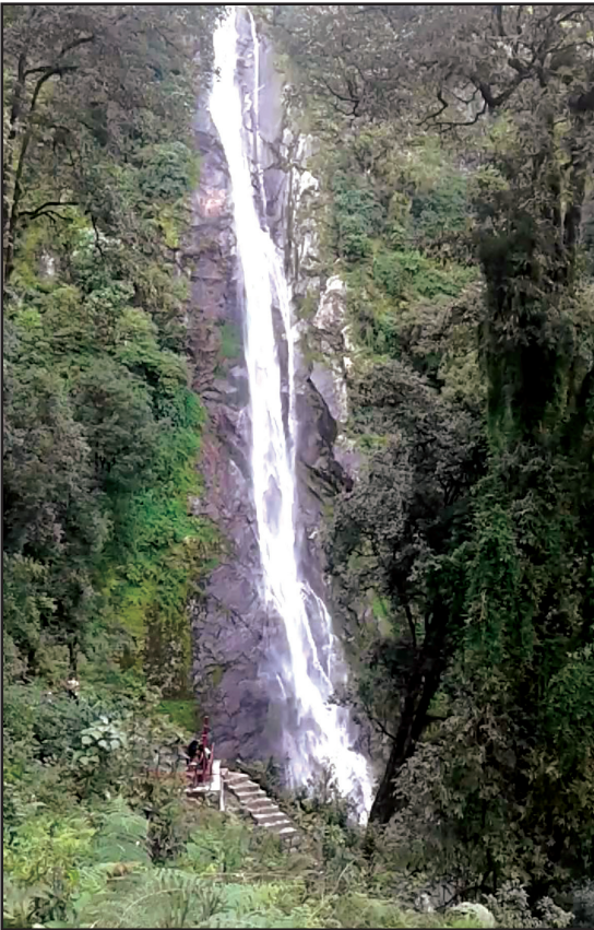
षडानन्द न.पा. वडा नं ३ खार्तम्छा स्थित छाँगै झरना