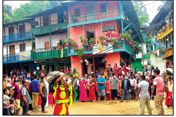
षडानन्द नगरपालिकाको केन्द्र दिला बजारमा नाचिने लाखे नाच