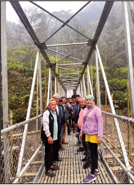
ष.न.पा.-३ खार्तम्छामा निर्माण सम्पन्न घडुवारी ट्रेस पुल