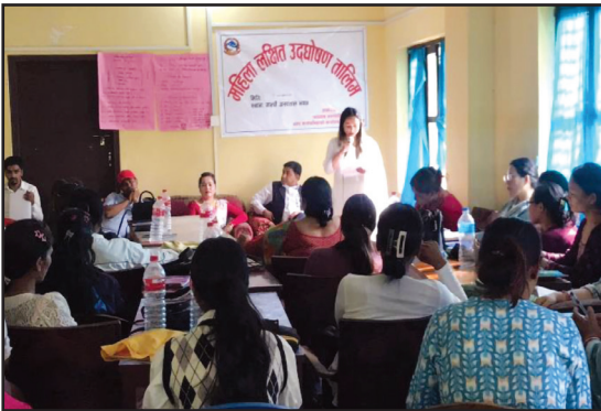
महिला लक्षित १५ दिने उद्घोषण तालिम