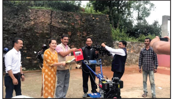
सेतो भटमास विस्तार कार्यक्रम अन्तर्गत कृषि समूह तथा फर्महरूलाई प्रविधि एवम् आवश्यक सामग्री हस्तान्तरण