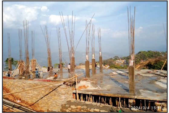
षडानन्द नगरपालिकाको निर्माणधीन प्रशासकीय भवन