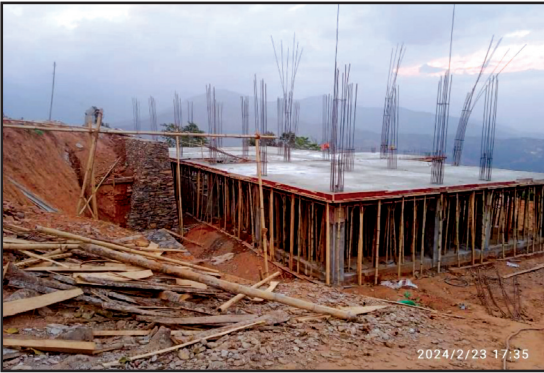
षडानन्द नगरपालिकाको निर्माणधीन प्रशासकीय भवन