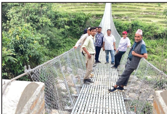
प्रदेश र षडानन्द नगरपालिकाको साझेदारीमा निर्माण विभिन्न झोलुङ्गेपुलहरू