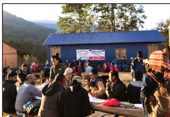
वडागत योजना समझौता एवम् उपभोक्ता समिति अभिमुखीकरण कार्यक्रम