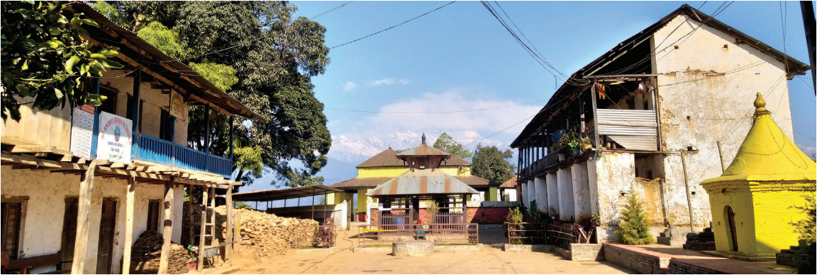
षडानन्द नगरपालिका दिला स्थित रामचन्द्र मन्दिर तथा गुठी परिसर