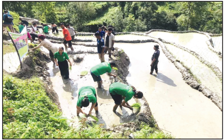
"जलवायु मैत्री कृषि, धान उत्पादनमा वृद्धि" भन्ने नाराका साथ षडानन्द नगरपालिकाले २१ औं राष्ट्रिय धान दिवस मनाइदै