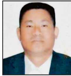
ढाकमान राई वडा अध्यक्ष