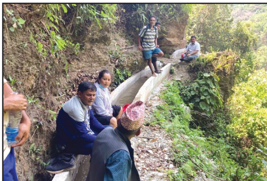
नगर स्तरीय अनुगमन समितिद्वारा साना सिंचाइ कार्यक्रम अन्तर्गत पित्तिम खमारे कुलो, भालुखोप मुहान लगायतका योजनाहरूको निर्माण कार्यको अनुगमन गरिदै