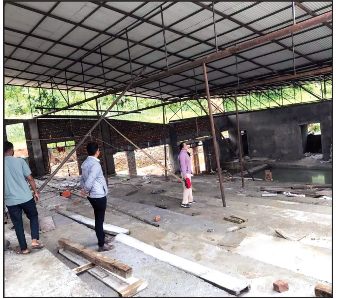
निर्माणाधीन षडानन्द सभा हल, ष.न.पा.-७