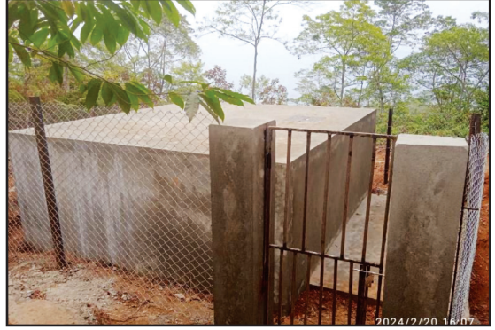
लमुखोला खानेपानी आयोजनाको षनपा वडा नं ६ वितरण रिजर्भ ट्याँक्री