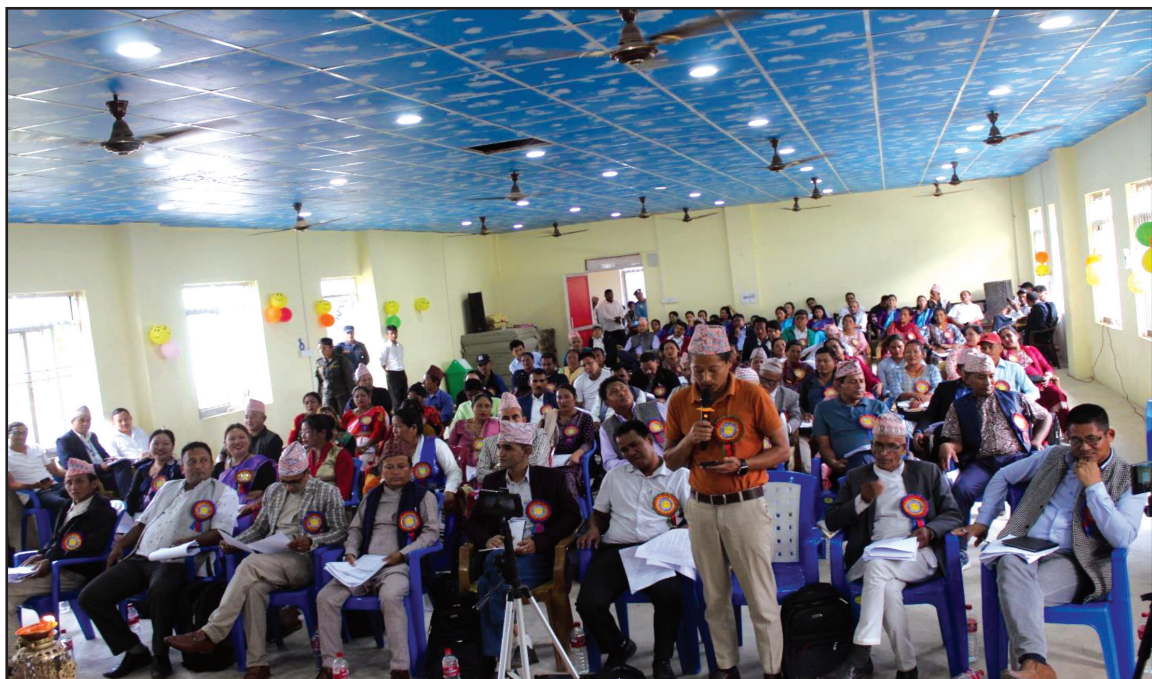
दशौं नगरसभा २०८१ मा उत्साहका साथ उपस्थित नगरसभा सदस्यज्यूहरु