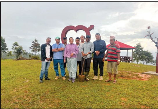
षडानन्द नपा वडा नं ११ मा निर्माण गरिएको धनसिंगे डाँडा पार्क निर्माण