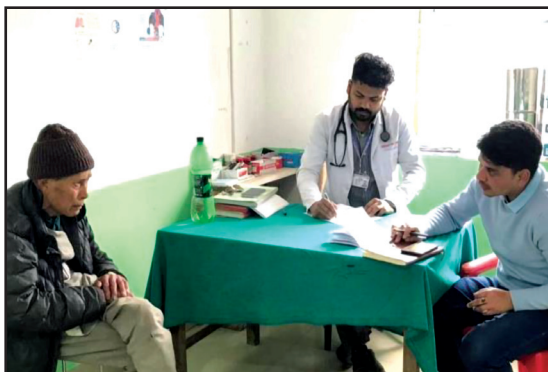
अपाङ्गता भएका व्यक्तिहरूको स्वास्थ्य जाँच तथा परितय पत्र वितरण शिविर