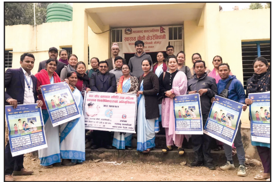
दादुरा रुबेला खोप अभियान कार्यक्रम