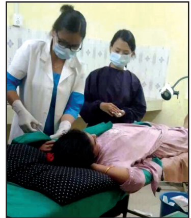
नगरवासी आमा, दिदीबहिनीहरूको, आइड खस्ने समस्याको उपचार र implant लगाउने, निकाल्ने निशुल्क शिविर सञ्चालन