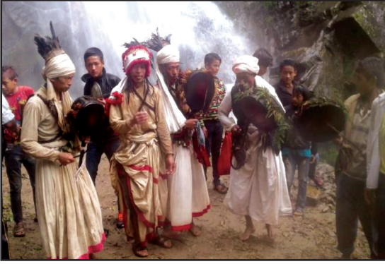
वडा नं ३ स्थित छाँगैधाम भदौ र वैशाखे पूर्णिमामा लाग्ने धार्मिक मेला