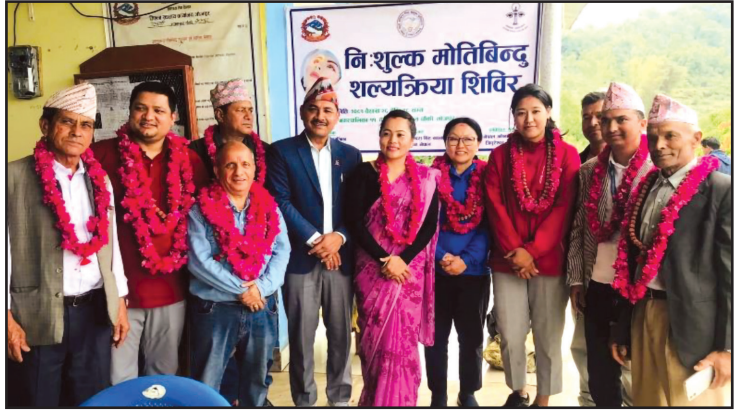
षडानन्द नगरपालिकाको आयोजना,नेपाल आँखा अस्पताल, त्रिपुरेश्वर काठमाडौंको प्राविधिक सहयोगमा तीन दिने निःशुल्क आँखा जाँच साथै मोतिबिन्दु शल्यक्रिया शिविर